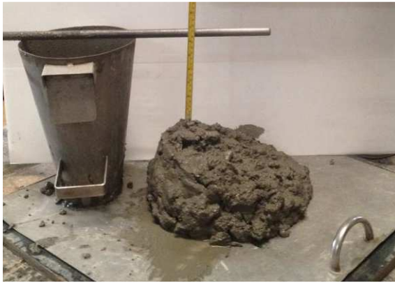
(5a) Natural aggregates concrete