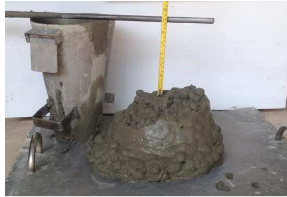
(5b) artificial aggregates concrete