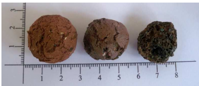
Figure 3 An example of a lump of clay burned at various temperatures.

Figure 3 ตัวอย่างของก้อนดินเหนียวที่เผาที่อุณหภูมิต่าง ๆ จะเห็นได้ว่าผิวของเม็ดดินมีลักษณะแตกต่างกันไปตามอุณหภูมิที่เพิ่มขึ้น รวมถึงระยะเวลาที่ใช้ในการเผาอีกด้วย ซึ่งเม็ดดินที่ขึ้นรูปแล้วจะนำไปอบที่อุณหภูมิที่ 100 องศาเซลเซียส เป็นเวลา 1 ชั่วโมง ก่อนที่จะนำไปเข้าเตาเผา