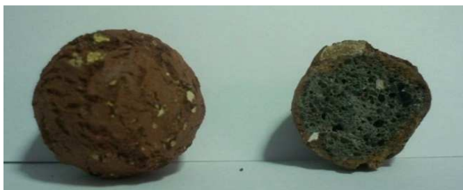
Figure 4 Samples of aggregates available and internal structure of aggregates

Figure 4 ตัวอย่างของก้อนมวลรวมที่พร้อมใช้งาน และโครงสร้างภายในของก้อนตัวอย่างมวลรวม ลักษณะของตัวอย่างที่ผ่านการเผาในอุณหภูมิที่ 1,200 องศา ใช้เวลาในการเผาของดินเหนียว 1 ชั่วโมง 48 นาที ก้อนมวลรวมที่ได้มีน้ำหนักที่เบา ผิวภายนอกแข็ง บางก้อนผิวด้านนอกมีลักษณะเป็นมัน ไม่ละลายน้ำ ภายในก้อนตัวอย่างมีลักษณะเป็นโพรงช่องว่างและมีรูพรุนมาก บางส่วนของมวลรวมสามารถลอยน้ำได้