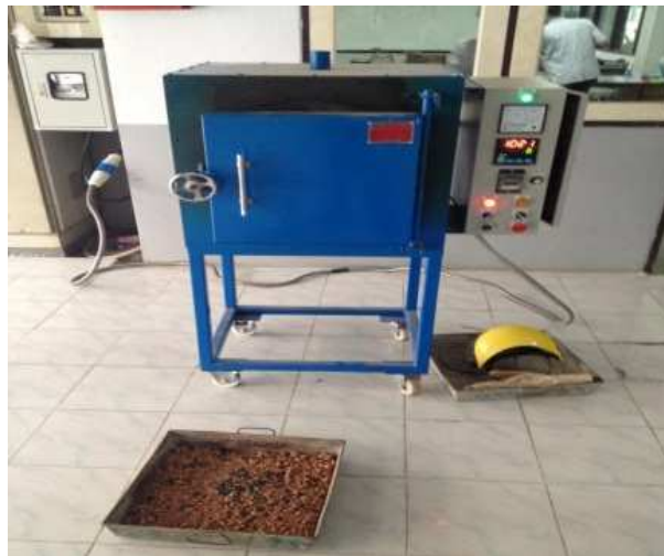
Figure 1 Kiln for Firing Clay

ส่วนที่ 2 การเตรียมเม็ดดินที่มีรูปร่างเป็นแบบทรงกลม การเผาให้ได้วัสดุมวลรวมหยาบตามที่กำหนดไว้ การหาอัตราออกแบบส่วนผสมของคอนกรีต ตามวิธีการออกแบบของ ACI 211.1-91 โดยกำหนดตัวแปรดังต่อไปนี้ W/C 0.5, 0.7 และ 0.9 ควบคุมค่ายุบตัว 3 ช่วงคือ 3-5, 8-10 และ 15-18 ซม. ค่าที่ใช้ในการออกแบบได้จากการทดสอบคุณสมบัติเบื้องต้นของวัสดุจากการทดสอบในส่วนที่ 1