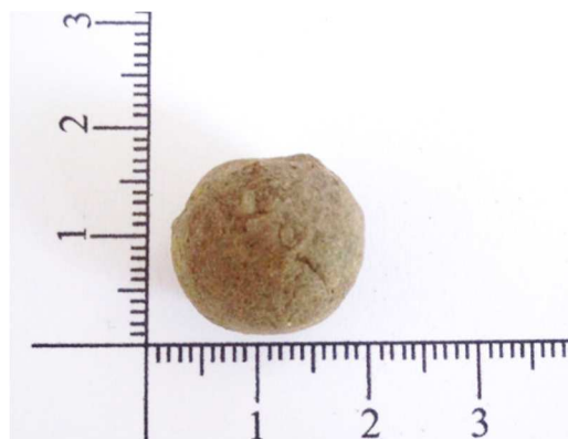
Figure 2 The molding of the clay aggregate

จาก Figure 2 ตัวอย่างการปั้นขึ้นรูปของดินเหนียว การขึ้นรูปของดินเหนียวจะมีลักษณะเป็นแบบทรงกลม โดยกำหนดให้มีขนาดเส้นผ่านศูนย์กลาง 1.00 - 2.00 เซนติเมตร และมีน้ำหนัก 4.5 - 5.5 กรัม และในการเผาดินเหนียวตัวอย่างโดยใช้อุณหภูมิในการเผาตั้งแต่ 800, 1,000 และ 1,200 องศาเซลเซียส ทดสอบหาเวลาที่ใช้ในการเผาดินเหนียวที่เหมาะสม เพื่อให้ได้มวลรวมที่มีน้ำหนักเบาและลักษณะของก้อนมวลรวมมีความสมบูรณ์มากที่สุด ไม่แตกหรือละลาย